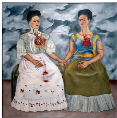
Frida Kahlo, Las Dos Fridas [Les deux Frida], 1939, huile sur toile, 173,5 × 173 cm, Museo de Arte Moderno, Mexico © Luisa Ricciarini/Leemage, © ADAGP, Paris