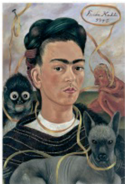
Frida Kahlo, Autoretrato con Changüto [Autoportrait avec un petit singe], 1945, huile sur Masonite, 41,5 x 56 cm, Museo Dolores Olmedo Patiño, Mexico © MP/Leemage, © ADAGP, Paris