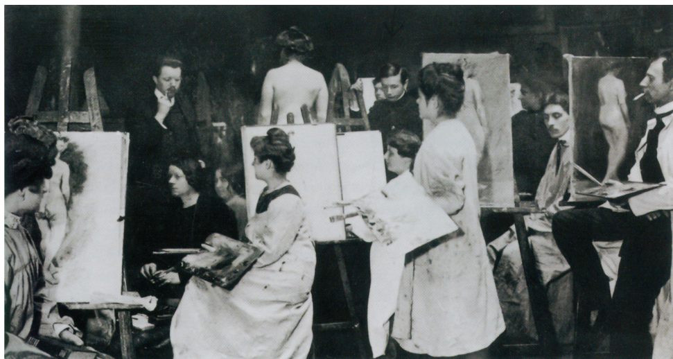
Cours de peinture à l'académie Matisse, vers 1910,