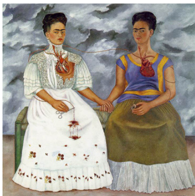
Frida Kahlo, Las Dos Fridas [Les deux Frida], 1939, huile sur toile, 173,5 x 173 cm, Museo de Arte Moderno, Mexico © Luisa Ricciarini/Leemage, © ADAGP, Paris