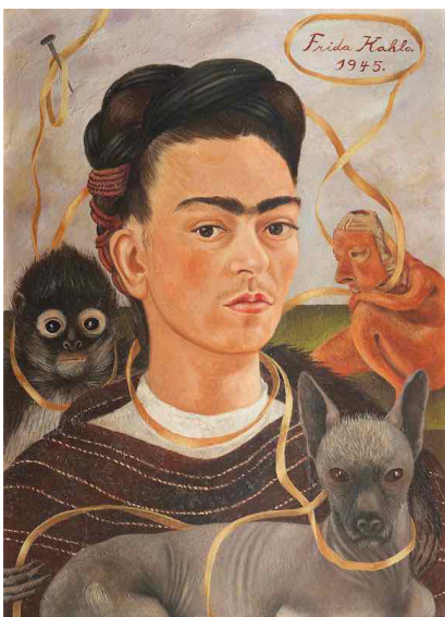
Frida Kahlo, Auto-retrato con Changuito [Autoportrait avec un petit singe], 1945, huile sur Masonite, 41,5 x 56 cm, Museo Dolores Olmedo Patiño, Mexico © MP/Leemage, © ADAGP, Paris